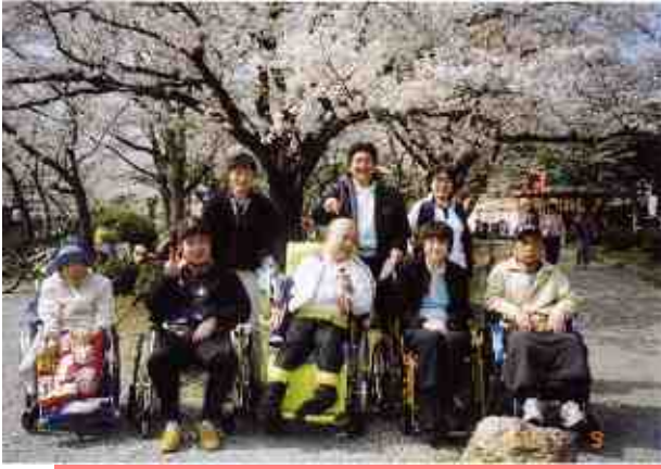
お花見 (身障 ふるさと)