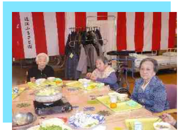
忘年会 (デイサービス)